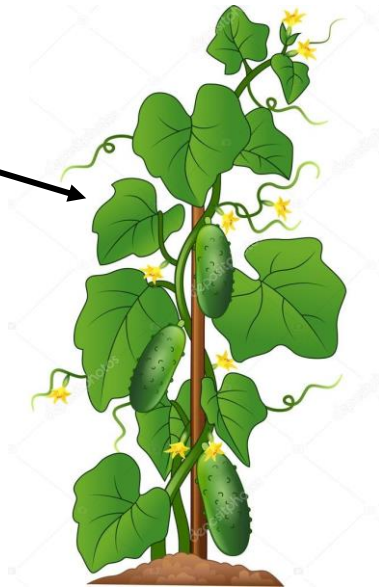
Illustration einer Gurkenpflanze.

Die Probenahme sollte bei einer der folgenden Entwicklungsstadien durchgeführt und angegeben werden: